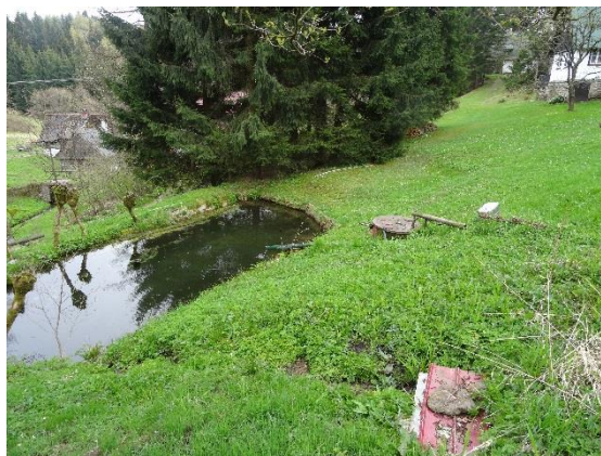
Obr. 18 Rybníček na přítoku Liberského potoka z pramenu u chaty ev.č. 058

Na Liberském potoce je v Kačerově pět můstků. Asfaltová silnice III/31816 Uhřínov – Kunčina Ves kříží Liberský potok přes kamenný most ( obr. 19 ). Druhým v údolí je původní kamenný klenutý můstek (u ev. č. 053) ( obr. 20 ), který, přestože je nyní v nedobrému stavu, je využíván majiteli blízké chalupy pro přejezd motorových vozidel a dopravu materiálu traktorem s vlekem. Třetí je nad cennou původní kamennou propustí pod cestou od silnice III/31816 ( obr. 21 ).