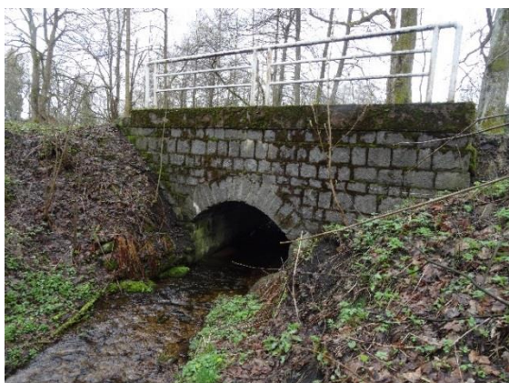
Obr. 19 Kamenný silniční most na silnici III/31816

Na Liberském potoce je v Kačerově pět můstků. Asfaltová silnice III/31816 Uhřínov – Kunčina Ves kříží Liberský potok přes kamenný most ( obr. 19 ). Druhým v údolí je původní kamenný klenutý můstek (u ev. č. 053) ( obr. 20 ), který, přestože je nyní v nedobrému stavu, je využíván majiteli blízké chalupy pro přejezd motorových vozidel a dopravu materiálu traktorem s vlekem. Třetí je nad cennou původní kamennou propustí pod cestou od silnice III/31816 ( obr. 21 ).