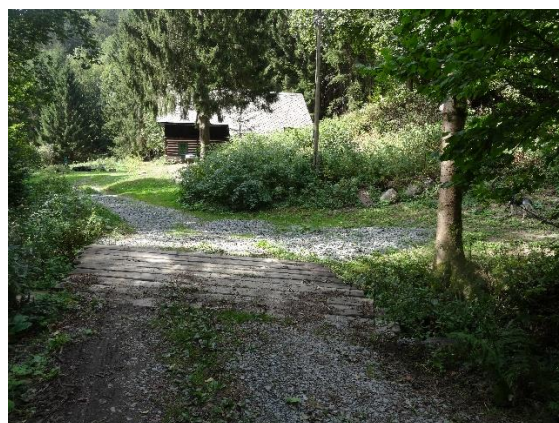
Obr. 26 Můstek v dolní části Kačerova na cestě údolím před ev.č. 067

Liberský potok je ve své dolní části pod Liberkem až k soutoku s Kněžnou uváděn jako pstruhový rybářský revír Českého rybářského svazu. Horní tok s přítoky je údajně chovný a je zde lov ryb zakázán. Zřejmě proto, dříve tak hojného pstruha obecného potočního těžko v Kačerově uvidíte.