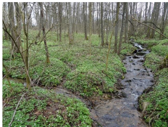
Obr. 12 Soutok Liberského potoka (na obrázku zleva) s přítokem z Kačerovského rašeliniště