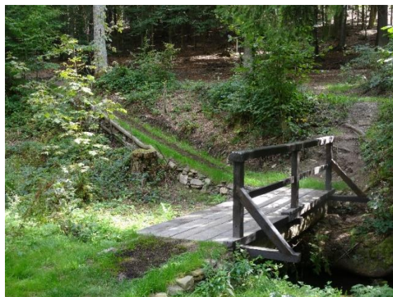
Obr. 24 Lávka u ev.č. 239