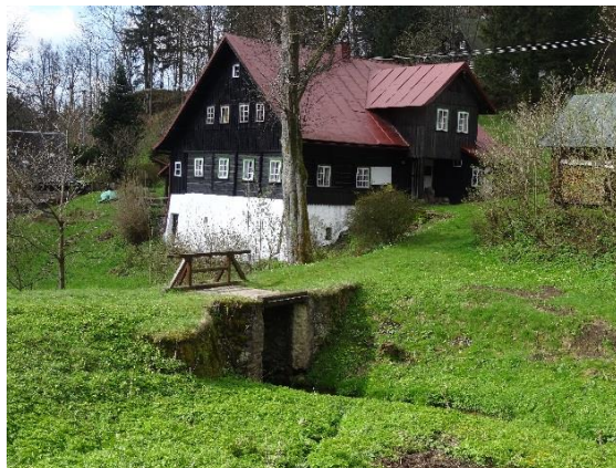
Obr. 22 Burgetův můstek u ev.č. 056. Násep cesty je možným pozůstatkem klauzy pro plavení dřeva