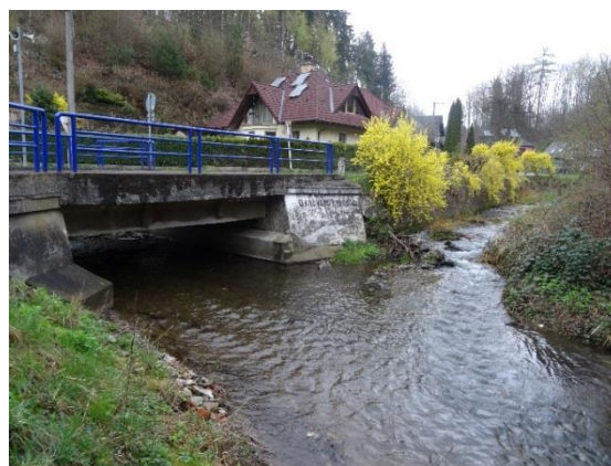
Obr. 2 Soutok Liberského potoka s říčkou Kněžnou v Panské Habrové u silnice III/31814

Liberský potok je zmiňován již v r. 1571 jako "potok Kaczerow" v souvislosti s plavením dřeva. Ve stabilním katastru je v Kačerově veden jako "Michelbach", nejspíše proto, že pramenil na pozemcích statkáře Michela. V horní části svého toku kříží potok lesní cestu starou kamennou propustí ( obr. 3 )