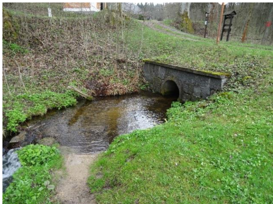
Obr. 13 Propustek u ev.č. 032 na přítoku z Kačerovského rašeliniště

Dalším významným přítokem je bezejmenný potok, který tvoří jižní hranici Kačerova s katastrálním územím Kunčina Ves. Tento přítok křížuje v jižní části Kačerova cestu podél Liberského potoka brodem z betonových panelů (obr. 14).