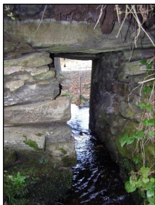
Obr. 21 Původní kamenná propust na hlavní přístupové cestě do údolí