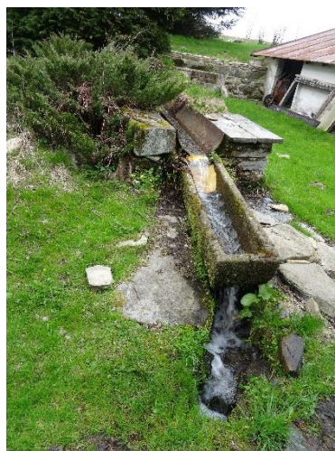
Obr. 9, 10 Ocelové koryto a vyústění potoka u ev.č. 040

Pod pamětní deskou padlým podtéká potok propustkem silnici III/31816 a spojuje se s přítokem od Kačerovského rašeliniště, který je v této části hlavní zdrojnicí vody Liberského potoka (obr. 12). Na obr. 13 je propustek u ev. č. 039, kterým přítéká voda z rezervace Kačerovské rašeliniště.