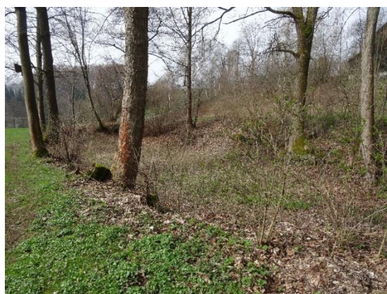
Obr. 16 Vypuštěný rybník pod ev.č. 051 pro bývalý mlýn (nyní ev.č. 054)

Vedle rybníků na Liberském potoce jsou nyní v údolí také dva nové malé rybníčky (u ev.č. 055 a u ev.č. 058 obr. 18). V Kačerově jsou zřejmé na dvou místech kolmo k potoku dva valy, které mohou být pozůstatkem dvou klaus pro plavení dřeva (u nynějšího ev. č. 032 a u ev. č. 056 (obr. 23)).