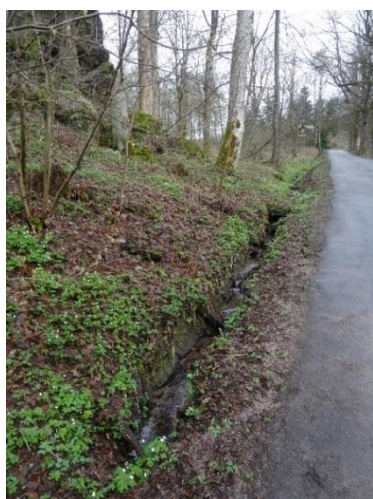
Obr. 11 Vedení potoka ve strouze podél silnice u desky padlých

Pod pamětní deskou padlým podtéká potok propustkem silnici III/31816 a spojuje se s přítokem od Kačerovského rašeliniště, který je v této části hlavní zdrojnicí vody Liberského potoka (obr. 12). Na obr. 13 je propustek u ev. č. 039, kterým přítéká voda z rezervace Kačerovské rašeliniště.