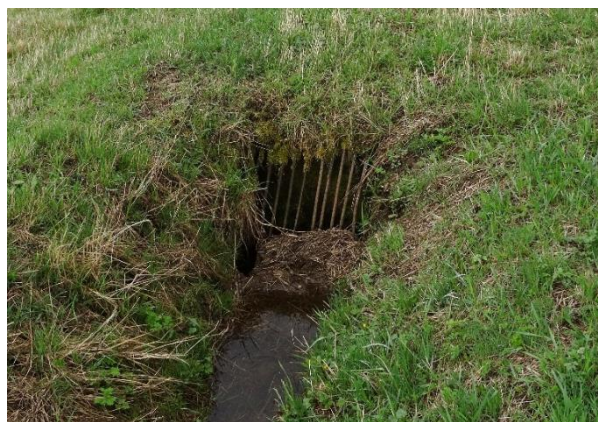
Obr. 6 Vstup do podzemního potrubí u silnice III/31814 na Rychnov nad Kněžnou