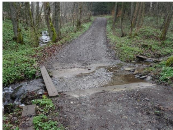
Obr. 14 Betonový brod na cestě údolím na levostranném přítoku potoka od Kunčiny Vsi

Na Liberském potoce byly v první polovině minulého století v Kačerově tři rybníky (horní pro tkalcovnu a dva pro mlýny níže). V současné době je napuštěný pouze horní rybník (obr. 15), druhý (pod ev.č. 051) je vypuštěný a je zčásti zavezen odpadem (obr. 16). Tento rybník dříve přiváděl vodu dřevěným náhonem do bývalého mlýna (nyní ev.č. 054). Třetí – dolní rybník (pod ev. č. 064) zanikl. Pod rozvalenou hrází třetího rybníka vytváří potok hluboké koryto (4 m) a nebezpečně podemílá cestu údolím (obr. 17). Z tohoto rybníka byla voda do dolního, již neexistujícího, mlýna přiváděna náhonem po vrstevnici, který je v terénu stále zřejmý. Kaskáda známých pěti Kačerovských rybníků na svahu údolí Kněžné nepatří k povodí Liberského potoka.