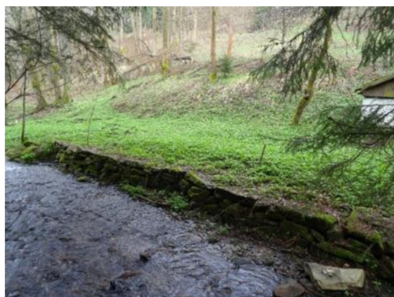
Obr. 25 Příklad původního zpevnění břehů potoka vyskládanými kameny