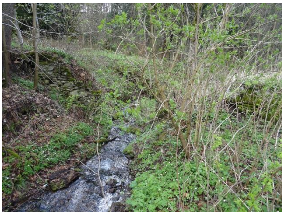
Obr. 17 Rozvalená hráz bývalého rybníka pod ev.č. 064