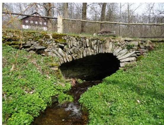
Obr. 20 Klenutý kamenný můstek u ev.č. 053