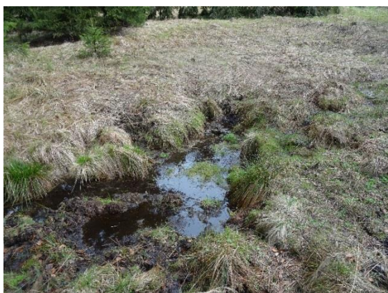
Obr. 1 Pramen Liberského potoka (50.25295N; 16.38695E)

Liberský potok tvoří osu celého katastrálního území Kačerova u Zdobnice. Pramení, podobně jako říčka Kněžná, na stráni hory Pláň (873 m n.m.) v tzv. Šajtavském lese. Na jaře jsou prameny v rašeliništi ve výšce 815 m n.m. na katastru Malé Zdobnice ( obr. 1 ) (50.25295N; 16.38695E), což je výše než pramen říčky Kněžné (795 m n.m.) Potok napájí také soustava rašelinišť nad bývalým kačerovským statkem č.p. 2 v tzv. Kačerovských houštinách a přírodní rezervace Kačerovské rašeliniště. Všechna rašeliniště, která napájí potok, se nachází v Chráněné krajinné oblasti Orlické Hory. Liberský potok protéká Kačerovem a Liberkem a asi po deseti kilometrech se vlévá do říčky Kněžné v obci Panská Habrová. Soutok je ve výšce 345 m n.m. těsně u odbočky na Lukavici ze silnice III/31814 ( obr. 2 ). Z celkové délky Liberského potoka je v katastru Kačerova u Zdobnice 3,3 km. V délce asi 1,5 km je v hranicích vesnické památkové zóny Kačerov. Potok a větší část území jeho břehů v Kačerově je ve správě Lesů ČR.