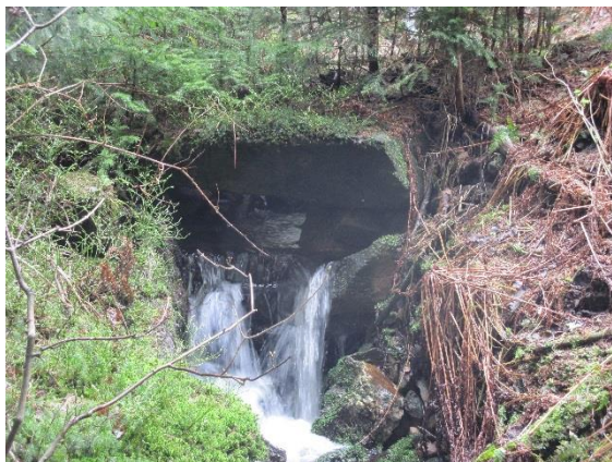
Obr. 3 Původní kamenná propust na lesní cestě nad bifurkací

( http://eagri.cz/public/web/mze/voda/aplikace/cevt.html ). Odbočka k ev.č. 037 do údolí Kněžné, zalomená v ostrém úhlu od původní strouhy, má nelogicky stejné číslo toku (10390415), jako přítok potoka k bifurkaci. Na mapě ale existuje jasné propojení obou toků, což neopravňuje k poškozování bifurkace a přehrazování přítoku vody do Liberského potoka (10185386). Logické by bylo, kdyby přímý přítok k bifurkaci měl stejné číslo jako Liberský potok. Nelogickým a možná i účelovým očíslováním přišel Liberský potok formálně o své historické prameny na úbočí hory Pláň. Díky jednání jediného vlastníka nemovitosti je opakovaně poškozována jak funkčnost starého technického díla, tak je silně omezen přítok vody pro dva rekreační objekty v horní části Kačerova. Z tohoto důvodu odtéká většina vody od pramenů do údolí Kněžné.