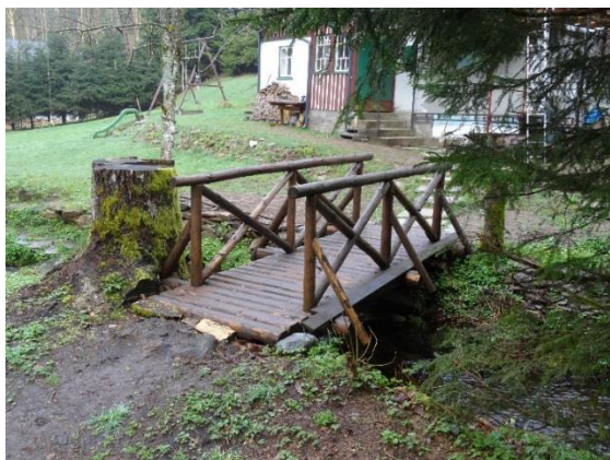
Obr. 23 Lávka u ev.č. 066

Od kačerovského kostela sv. Kateřiny sestupuje do údolí Liberského potoka modrá turistická značka (trasa 1849) ze Zdobnice, která dále vede téměř pět kilometrů podél potoka až do Liberka.