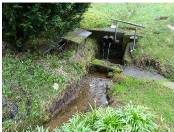
Obr. 8 Vyústění potoka u ev.č. 039