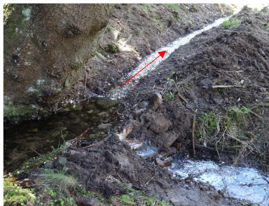
Obr. 4 Rozdvojení Liberského potoka nad bývalým č.p. 2 po obnově v dubnu 2016. Ve směru šipky by měla část vody téct do Kačerova

Liberský potok teče pod křižovatkou silnice na Rychnov nad Kněžnou se silnicí, která spojuje Uhřínov a Kunčinu Ves (III/31816) ( obr. 5 ) a dále v délce asi 150 m umělou strouhou podél silnice III/31814 na Rychnov nad Kněžnou ( obr. 6 ). Pak je přes pole veden asi 120 m podzemním potrubím k chalupám ev. č. 039 a 040 ( obr. 7, 8, 9, 10 ) k silnici na Kunčinu Ves (III/31816) ( obr. 11 ). Bylo by žádoucí, aby Lesy ČR realizovaly plánované odkrytí potoka a břehům daly přírodní charakter i zde. V této části je trasa toku potoka na mapách uváděna chybně.