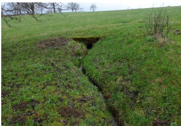
Obr. 7 Výstup potoka z podzemního potrubí nad ev.č. 039