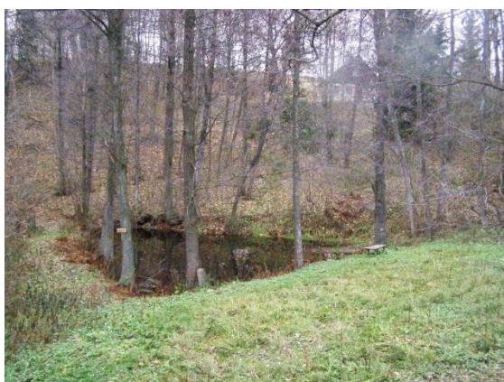
Obr. 15 Rybník pro bývalou tkalcovnu (nyní je na jejích základech postavena chata ev.č. 052)

Na Liberském potoce byly v první polovině minulého století v Kačerově tři rybníky (horní pro tkalcovnu a dva pro mlýny níže). V současné době je napuštěný pouze horní rybník (obr. 15), druhý (pod ev.č. 051) je vypuštěný a je zčásti zavezen odpadem (obr. 16). Tento rybník dříve přiváděl vodu dřevěným náhonem do bývalého mlýna (nyní ev.č. 054). Třetí – dolní rybník (pod ev. č. 064) zanikl. Pod rozvalenou hrází třetího rybníka vytváří potok hluboké koryto (4 m) a nebezpečně podemílá cestu údolím (obr. 17). Z tohoto rybníka byla voda do dolního, již neexistujícího, mlýna přiváděna náhonem po vrstevnici, který je v terénu stále zřejmý. Kaskáda známých pěti Kačerovských rybníků na svahu údolí Kněžné nepatří k povodí Liberského potoka.