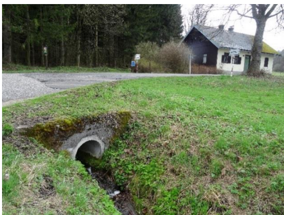
Obr. 5 Propustek na křižovatce silnic III/31816 a III/31814 v horní části Kačerova u č.p. 074

Liberský potok teče pod křižovatkou silnice na Rychnov nad Kněžnou se silnicí, která spojuje Uhřínov a Kunčinu Ves (III/31816) ( obr. 5 ) a dále v délce asi 150 m umělou strouhou podél silnice III/31814 na Rychnov nad Kněžnou ( obr. 6 ). Pak je přes pole veden asi 120 m podzemním potrubím k chalupám ev. č. 039 a 040 ( obr. 7, 8, 9, 10 ) k silnici na Kunčinu Ves (III/31816) ( obr. 11 ). Bylo by žádoucí, aby Lesy ČR realizovaly plánované odkrytí potoka a břehům daly přírodní charakter i zde. V této části je trasa toku potoka na mapách uváděna chybně.